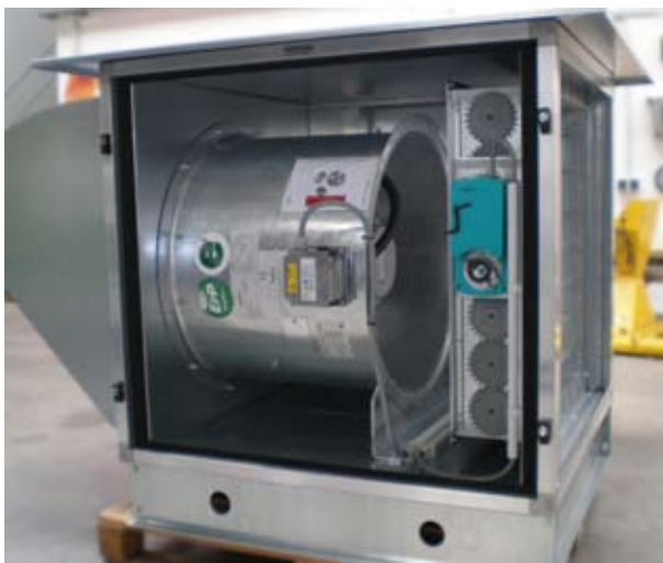
Innensicht DBA Ventilatorbox