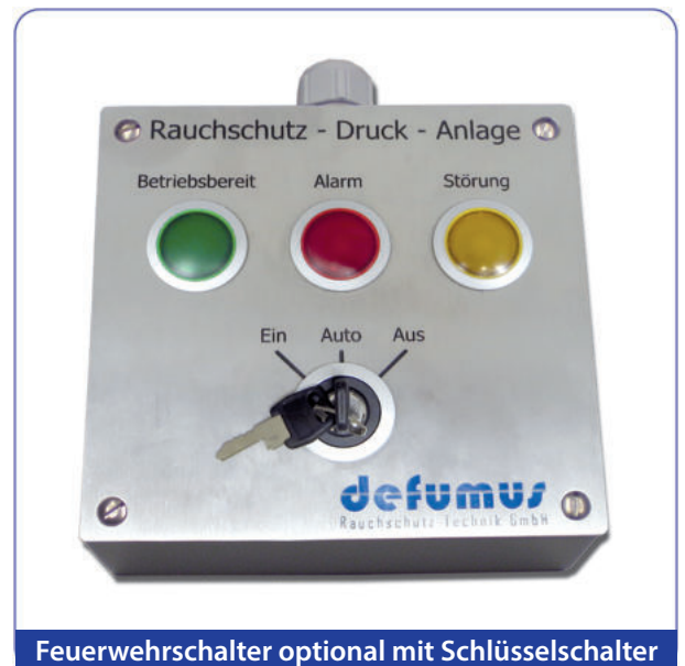
Feuerwehrscharter optional mit Schlüsselscharter