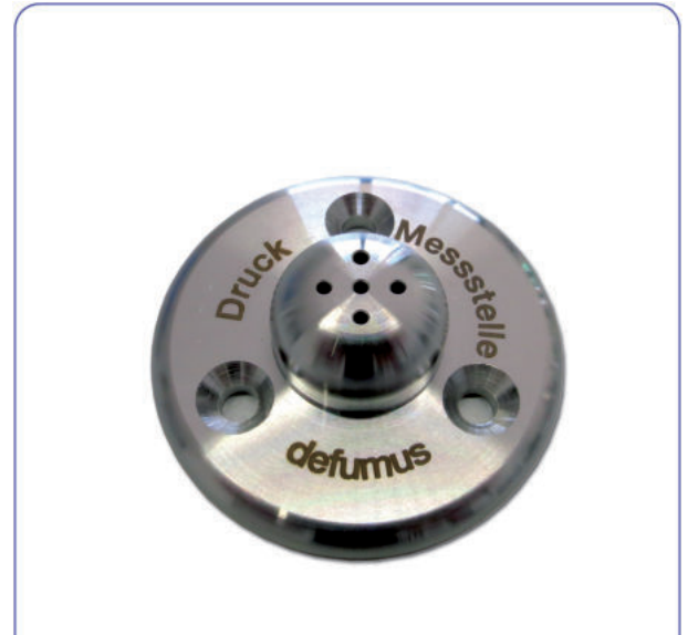
Druckmessstelle, alternative Ausführung

Edelstahl inkl. Einführung für Druckmessleitung rückseitig, Maße (D x T): ca. 50 x 16 mm