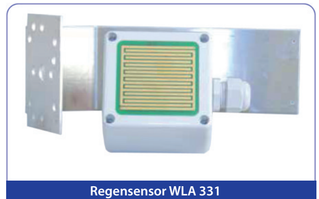
Regensensor WLA 331