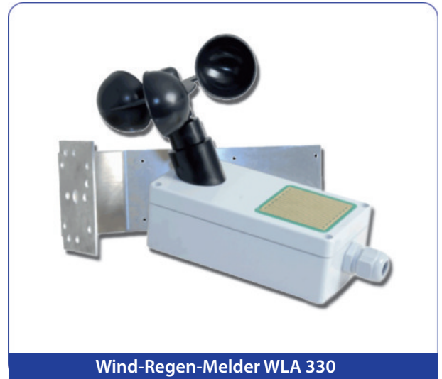
Wind-Regen-Melder WLA 330

Technische Änderungen vorbehalten Stand: 01.03. 2018